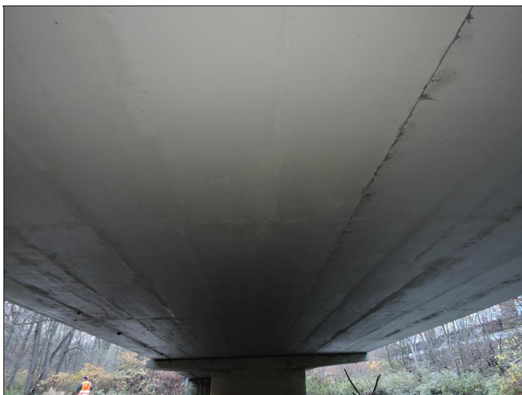
Podhled na NK pole 2