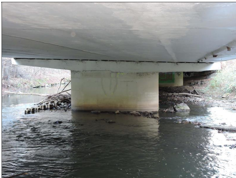
P2 pole 1