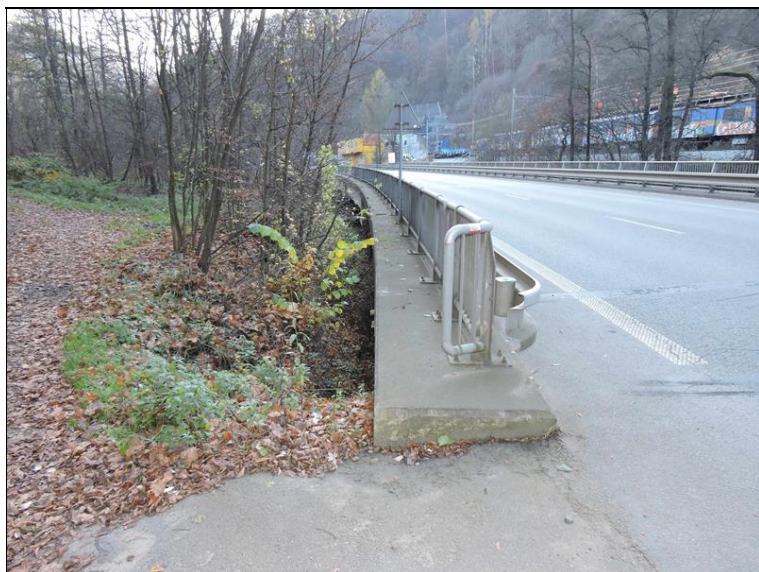
Celkový pohled PS POS