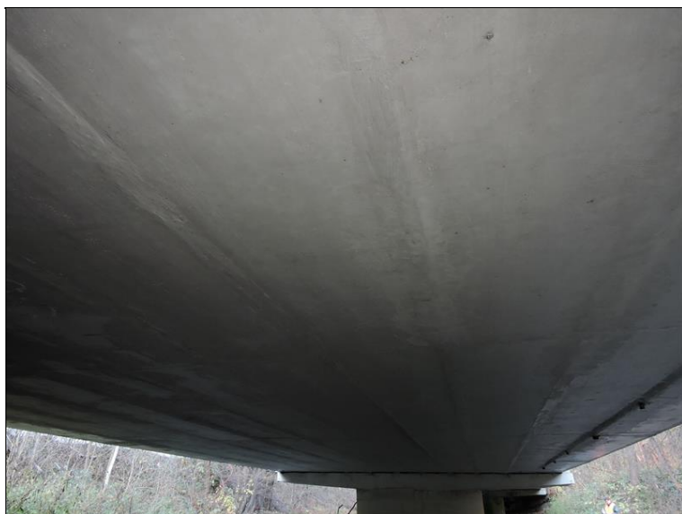
Podhled na NK pole 1