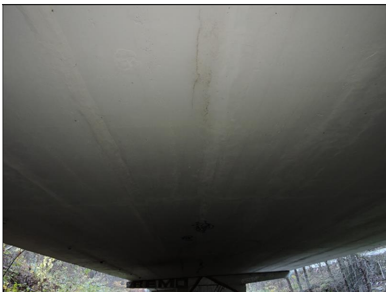
Podhled na NK pole 3