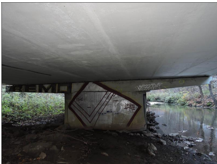
P3 pole 3