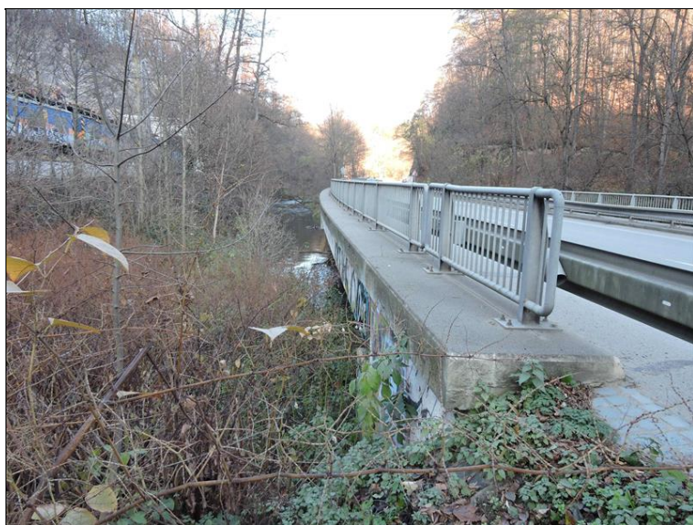
Celkový pohled LS NAS