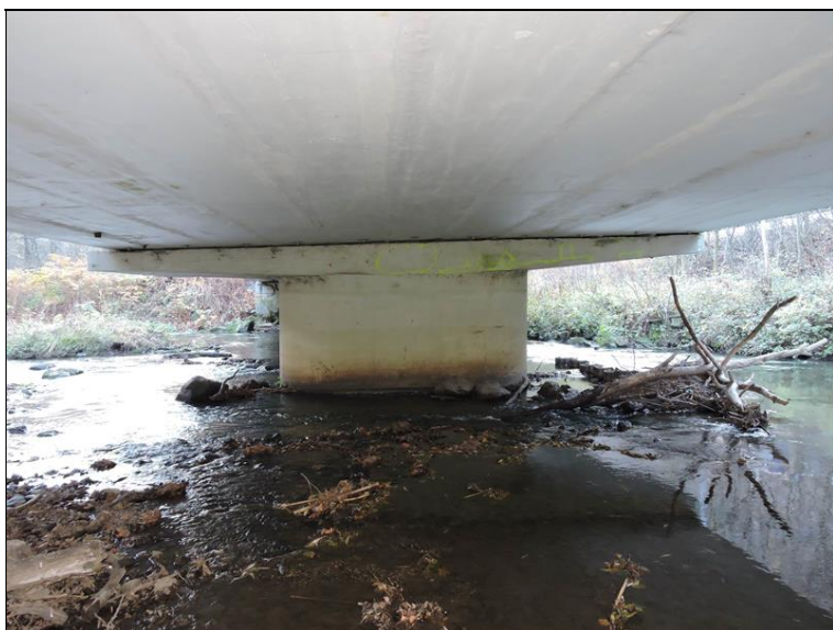
P2 pole 2