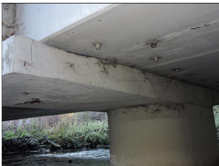
P2 pole 2 - podélná trhlina