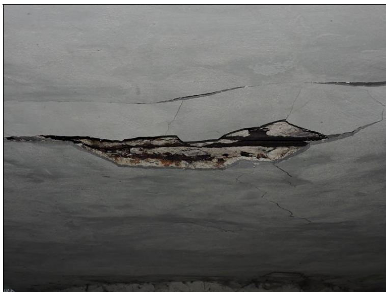
P2 uprostřed mezi polem 1 a 2