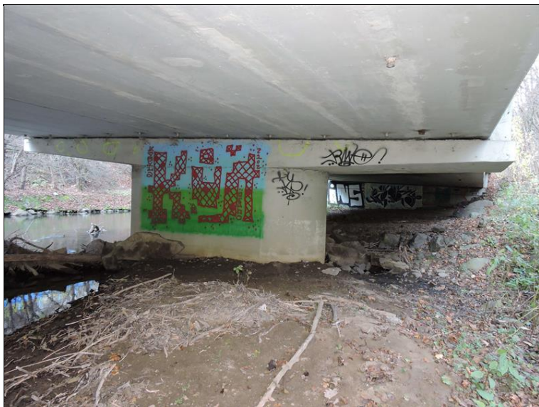
P2 pole 2